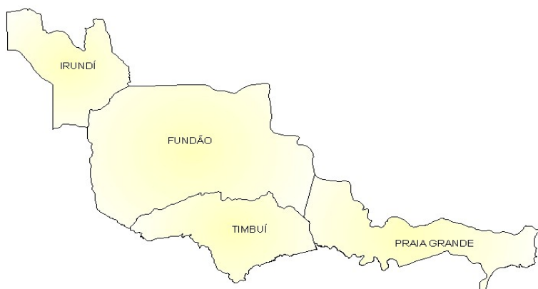
Figura 1 – Mapa do município/ distritos

É formado por 4 (quatro) distritos: Distrito Sede, Timbuí, Irundi e Praia Grande, possui uma população em torno de 15.228 habitantes, sendo 13.130 residentes no setor urbano e 2.098 na zona rural, sendo que em 2000 a população era 13.009 e em 2006 era de 15.082 e a densidade demográfica em 2000 era de 45,2 e em 2006 a densidade passou para 52,4 (pessoas por quilômetros quadrado).